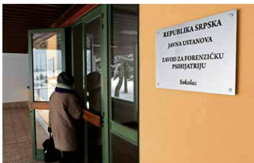
Zavod na Sokocu prima pacijente iz cijele BiH

Zavod na Sokocu ima kapacitet od 200 ležaja, a s radom je počeo u decembru 2016. godine