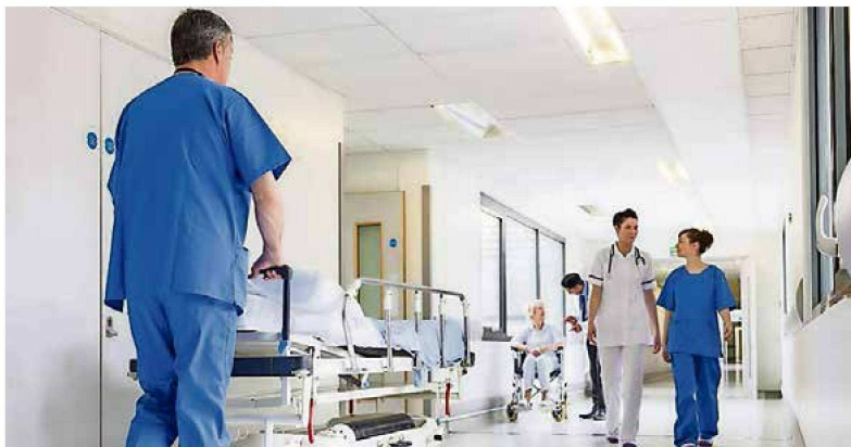
Model otpusta znači da bolesnici neće biti bez skrbi