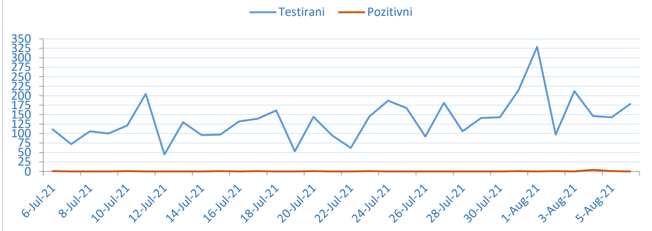
COVID-19 Brčko distrikt BiH (26.03.2020. - 06.08.2021.)