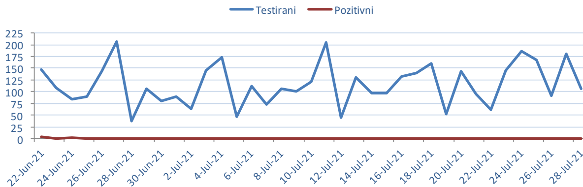
COVID-19 Brčko distrikt BiH (26.03.2020. - 28.07.2021.)