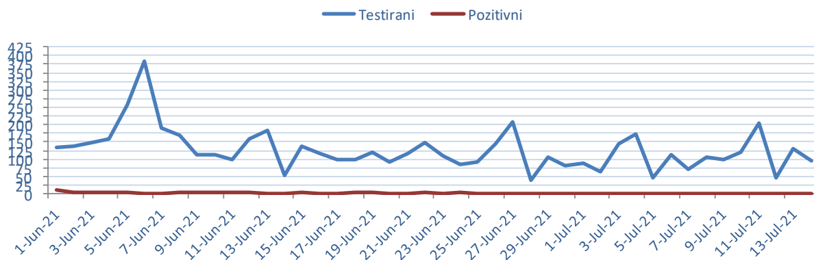
COVID-19 Brčko distrikt BiH (26.03.2020. - 14.07.2021.)