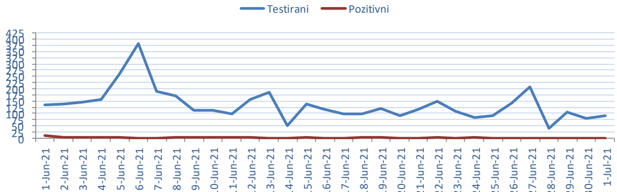
COVID-19 Brčko distrikt BiH (26.03.2020. - 01.07.2021.)