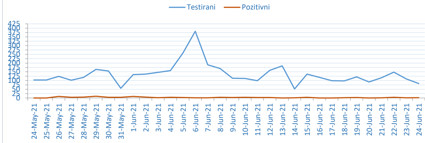
COVID-19 Brčko distrikt BiH (26.03.2020. - 24.06.2021.)