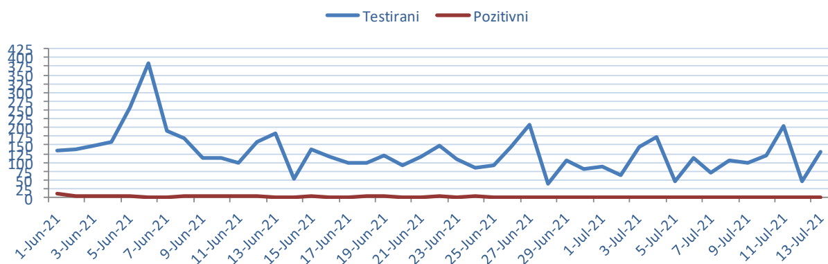
COVID-19 Brčko distrikt BiH (26.03.2020. - 13.07.2021.)