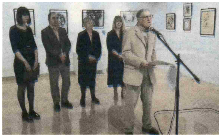
Sa otvorenja izložbe