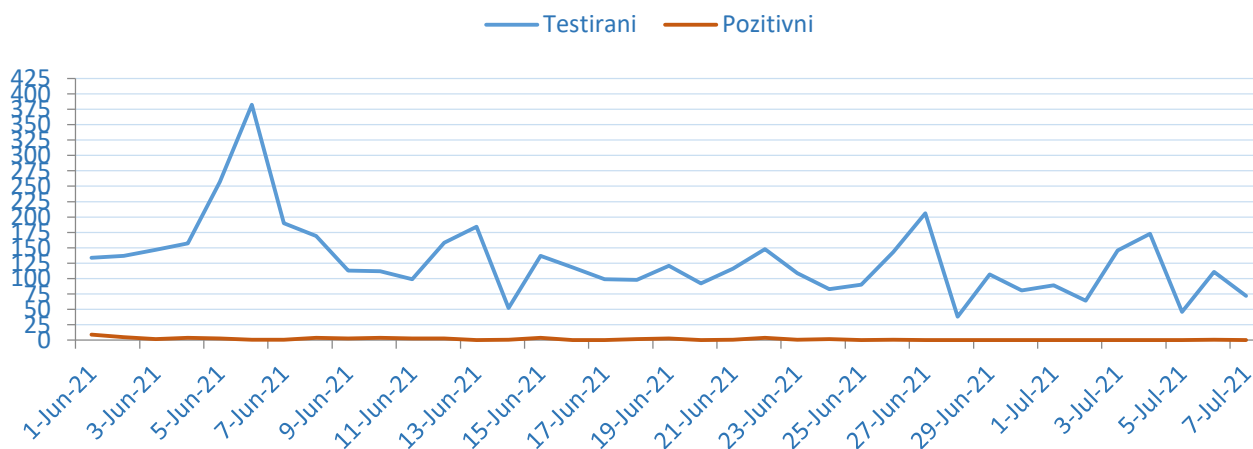
COVID-19 Brčko distrikt BiH (26.03.2020. - 07.07.2021.)