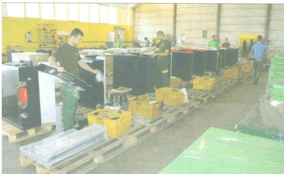
Kako mlade motivirati da ostanu u BiH

- Udruženje LUX mnogo radi, ciljevi su jasni. Mi smo svoje ciljeve o tome kako motivirati mlade po-