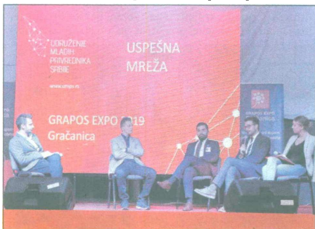
S panel-diskusije na "Grapos-Expou"