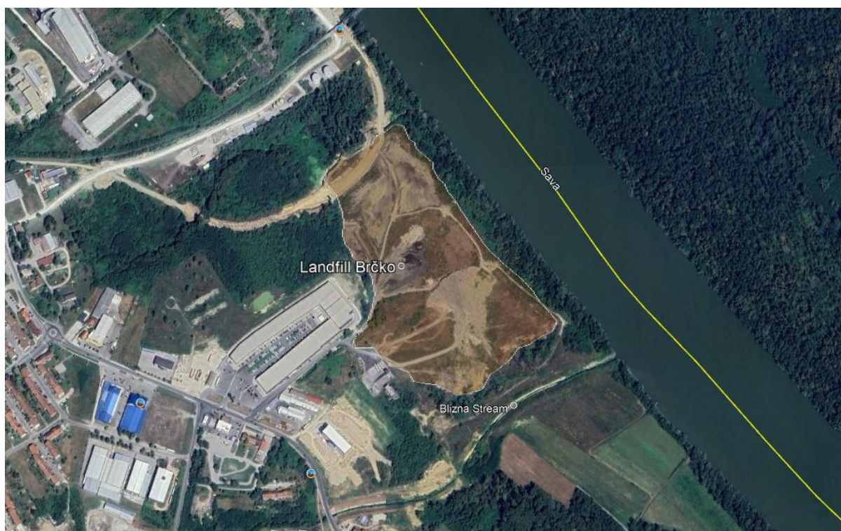
Slika 1 Lokacija odlagališta otpada Brčko

Odlagalište otpada zauzima površinu od približno 11,5 hektara, unutar trgovačko-industrijske zone Brčko Distrikta, s pristupom preko ceste duge 250 metara koja se odvaja od glavne ceste M14.1. Lokacija je na jugu ograničena neimenovanim vodotokom koji teče uz granicu, na sjeveroistoku 50-metarskim pojasom vegetacije koji odvaja odlagalište od rijeke Save, a na jugo-jugoistoku još jednim 50-metarskim zelenim tampon-prostorom koji vodi do potoka Blizna . Na sjeverozapadnoj granici, uz odlagalište, nalaze se trenutna stanica za pretovar otpada, koja ujedno služi i kao glavni ulaz, te Trgovački centar City Park Brčko. Lokacija odlagališta otpada u Brčkom prikazana je na Slika 1.