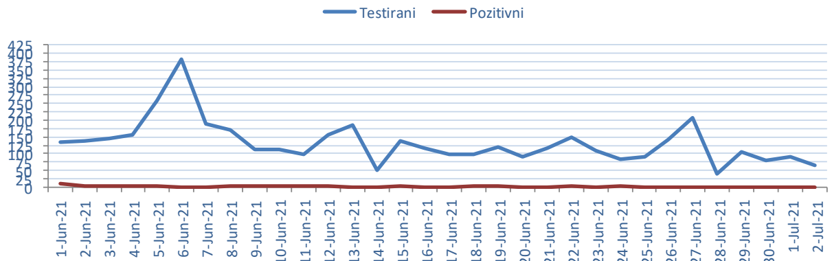
COVID-19 Brčko distrikt BiH (26.03.2020. - 02.07.2021.)