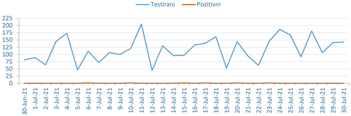
COVID-19 Brčko distrikt BiH (26.03.2020. - 30.07.2021.)