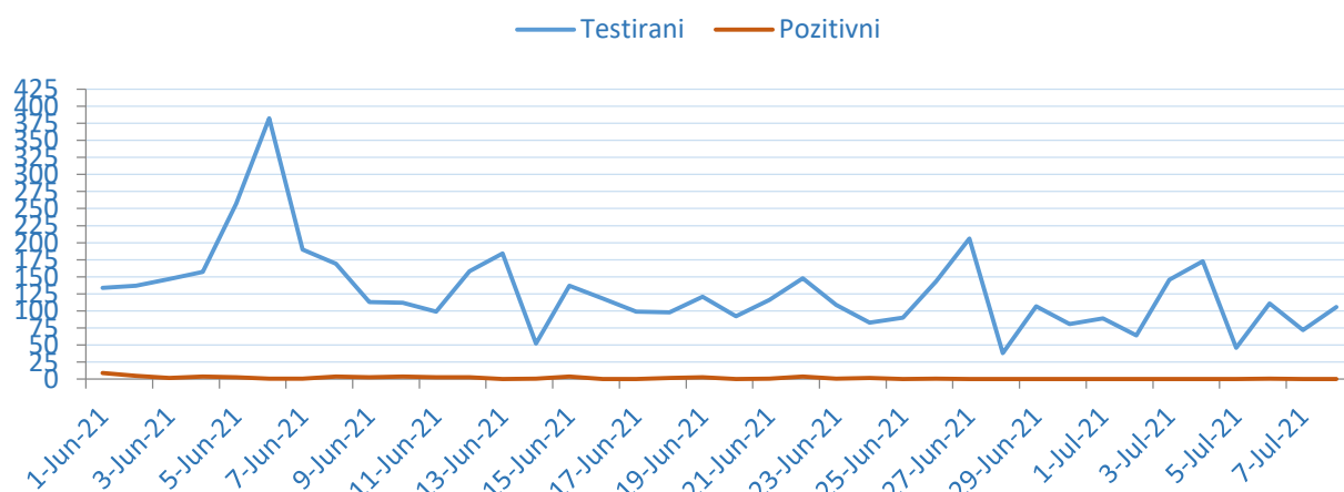
COVID-19 Brčko distrikt BiH (26.03.2020. - 08.07.2021.)