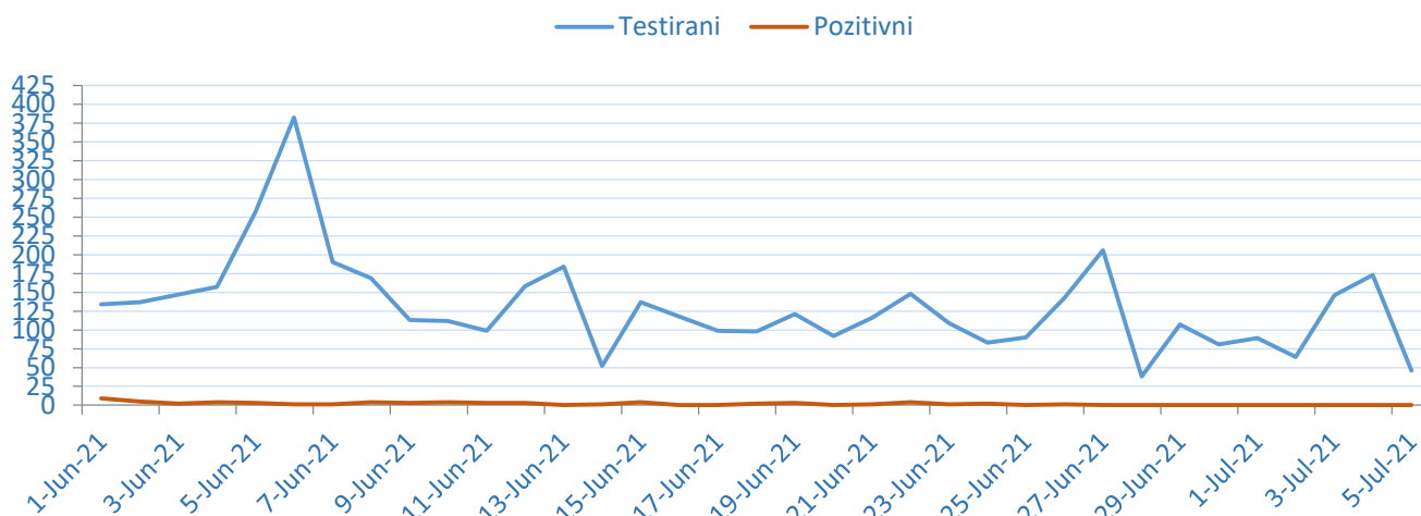
COVID-19 Brčko distrikt BiH (26.03.2020. - 05.07.2021.)